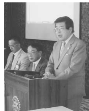
▲ 小松島RC(平成22年10月29日)