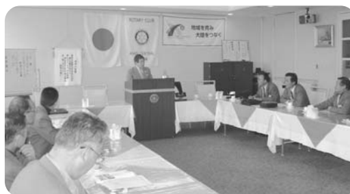
▲ 阿南中央RC(平成22年10月27日)