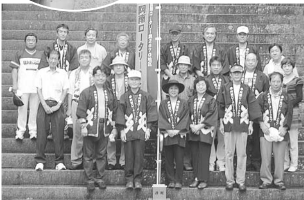
▲ 第7回 太龍寺お接待 (平成22年8月29日)