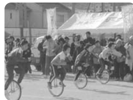
▼ 第23回 一輪車大会 (平成23年1月10日)