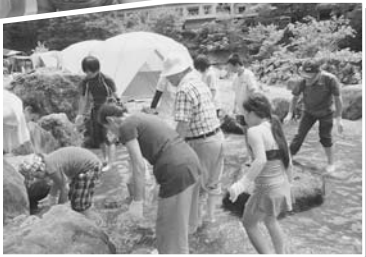
▲ アメゴの掴み取りに集中しています！

今年の納涼家族会は、6年ぶりに北の脇を離れて、上勝町の月ヶ谷温泉村キャンプ場にて行なわれました。会員とそのご家族合わせて約40名のご参加をいただきました。