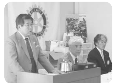
▲ 徳島眉山RC(平成22年10月7日)