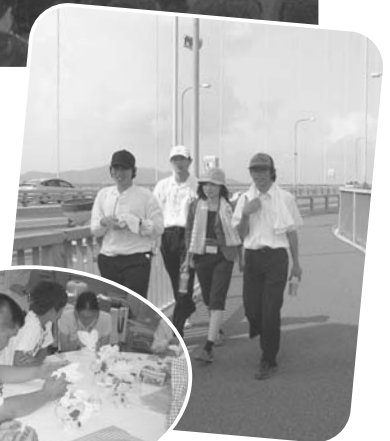
▲タオル人形製作中！