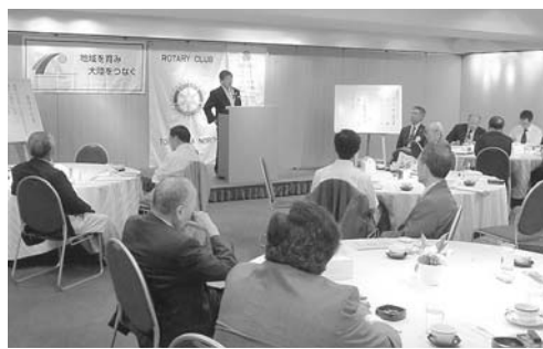
▲ 徳島北RC(平成22年 9月27日)