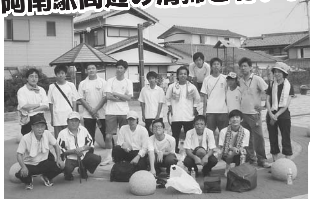
▲ 阿南駅前児童公園にて 参加者：インターアクトクラブ13名 / 教職員3名 / 阿南RC 大津・田村

8月11日(木) AM9:00から、阿南工業インターアクトクラブ員が行う阿南駅周辺の清掃に参加しました。