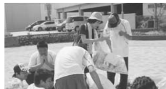
▼ 線路沿いを清掃中