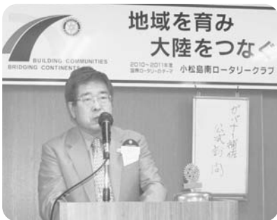
▲ 小松島南RC(平成22年 8月18日)