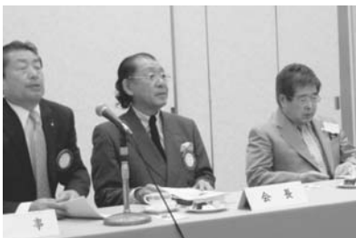
▲ 徳島RC(平成22年 8月18日)